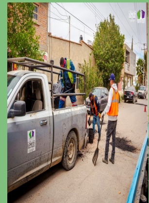
SE CONTINÚA CON EL BACHEO DE VARIAS CALLES EN LA CABECERA MUNICIPAL