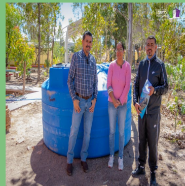
ENTREGA DE MATERIAL PARA LAS ESCUELAS DE NÍVEL BÁSICO DE LA COMUNIDAD DE EL LOBO