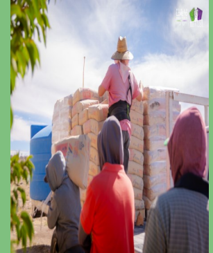
ENTREGA DE CEMENTO PARA LA CONSTRUCCIÓN DE LA CANCHA DE USOS MULTIPLES EN LA ESCUELA EMSAD DE LA CONCEPCIÓN