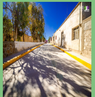
PAVIMENTACIÓN EN LA CALLE 5 DE MAYO EN LA COMUNIDAD DE LA CONCEPCIÓN