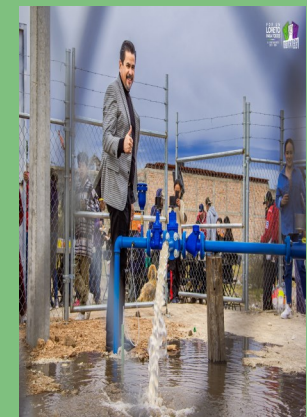
ENTREGA DE LA OBRA DE PERFORACIÓN DE POZO DE AGUA POTABLE EN BIMBALETES