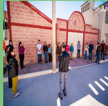
OBRA DE PAVIMENTACIÓN EN LA CALLE SOLIDARIDAD DE LA CABECERA MUNICIPAL